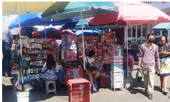
El comercio ambulante ‘invade’ el centro histórico de Acámbaro durante la temporada de navidad y año nuevo

1.- Por la navidad y el año nuevo, ya preparan la instalación de ambulantes.- Tanto para diciembre como para enero, la Alcaldía de Claudia “La Pollita” Silva prevé la ubicación del comercio ambulante en el centro ciudadano. Es un asunto anual y por supuesto, se invade todo el sector. Así, se utilizan las calles Pino Suárez, entre Madero y la Hidalgo; Hidalgo, entre Aldama-Ocampo y la Allende y la Guerrero, entre Hidalgo y la Primero de Mayo. Y por si fuera poco, también la zona de la Fuente Taurina y la Abasolo, entre Hidalgo y la Morelos. El hecho no es casual, pues el ingreso que capta la Tesorería Municipal es mayúsculo en esta temporada, junto con el predial. Lamentablemente, es un ingreso que no se reporta públicamente. En los últimos años, incluyendo los de la pandemia del coronavirus, se han registrado hasta mil comerciantes en el sector, incluyendo un buen número que son de coyuntura, es decir, que sólo ‘aparecen’ en estas fechas del año. Ya veremos cuántos comerciantes ‘invaden’ el centro histórico de Acámbaro y cuánto dinero generan. Ya veremos!.