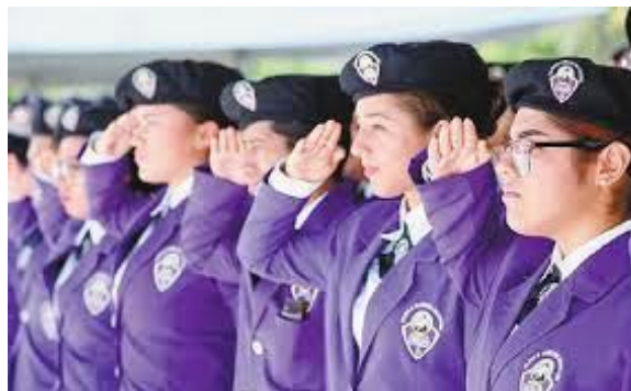
La Preparatoria Militarizada prevista para Acámbaro entraría en operación en agosto o septiembre de 2023

3.- Todo indica que no habrá Prepa Militarizada para el ciclo lectivo 2022-2023.- Salvo que se anuncie lo contrario por el Gobierno del Estado, en el actual ciclo lectivo 2022-2023 no entrará en operación la Preparatoria Militarizada que ofreció Diego Sinhue Rodríguez Vallejo. El Gobernador hizo la propuesta el 10 de octubre de 2021 en el acto de la toma de protesta del actual cabildo, pero a la fecha no hay nada seguro. Se sabe que el municipio apoya la gestión para disponer de una sede, pero al mes de diciembre de 2022, la institución no ha iniciado actividades. Debió hacerlo desde el pasado mes de agosto o septiembre y tal vez, la Prepa comience labores en el ciclo 2023-2024. Serán dos años después del anuncio inicial. Todo indica que alguien o algunos -como se ha comentado-, no hicieron la tarea para disponer de un edificio propio y habrá qué rentar uno, lo que encarece el plan. De momento, los jóvenes del sureste de Guanajuato siguen esperando la confirmación del proyecto para inscribirse. Esperemos que logre materializarse. “Más vale tarde que nunca”.