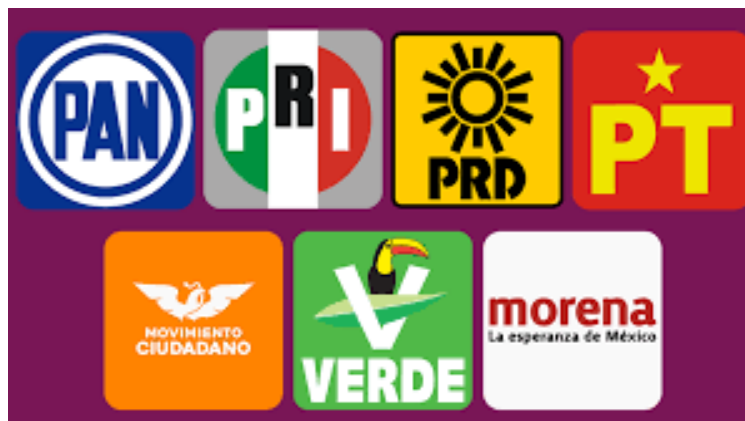
Salvo el PAN y MORENA, los demás partidos políticos “duermen el sueño de los justos”

3.- En Guanajuato “duermen el sueño de los justos”, los partidos de Oposición.- Salvo lo que hacen el PAN y MORENA a manera de preparación para la elección estatal del 2024, los demás partidos políticos “brillan” por su ausencia, o mejor dicho, “duermen el sueño de los justos”. En el otrora partido hegemónico, el PRI, sólo su dirigencia estatal sabe lo que está haciendo, al igual que el PRD - que podría perder el registro legal en la próxima elección-, PT, Verde y el Movimiento Ciudadano (MC). Todos esperan el momento ideal para fortalecer su presencia comunitaria y en su caso, ganar en los comicios del 2024 en los niveles de Presidencia de la República, Senadurías y Diputaciones Federales, así como la Gubernatura, Diputados locales y Ayuntamientos. Ninguno de los partidos de oposición realiza trabajo social en beneficio de la población. Son electoreros y así se mantendrán. La lucha real por lo tanto, la tendrán el PAN y MORENA. Ya veremos.